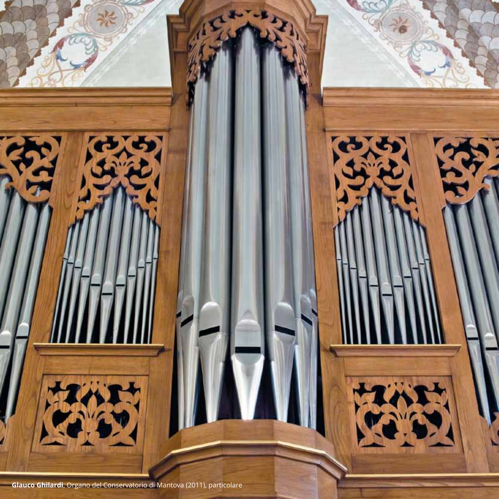
Glauco Ghilardi , Organo del Conservatorio di Mantova (2011), particolare