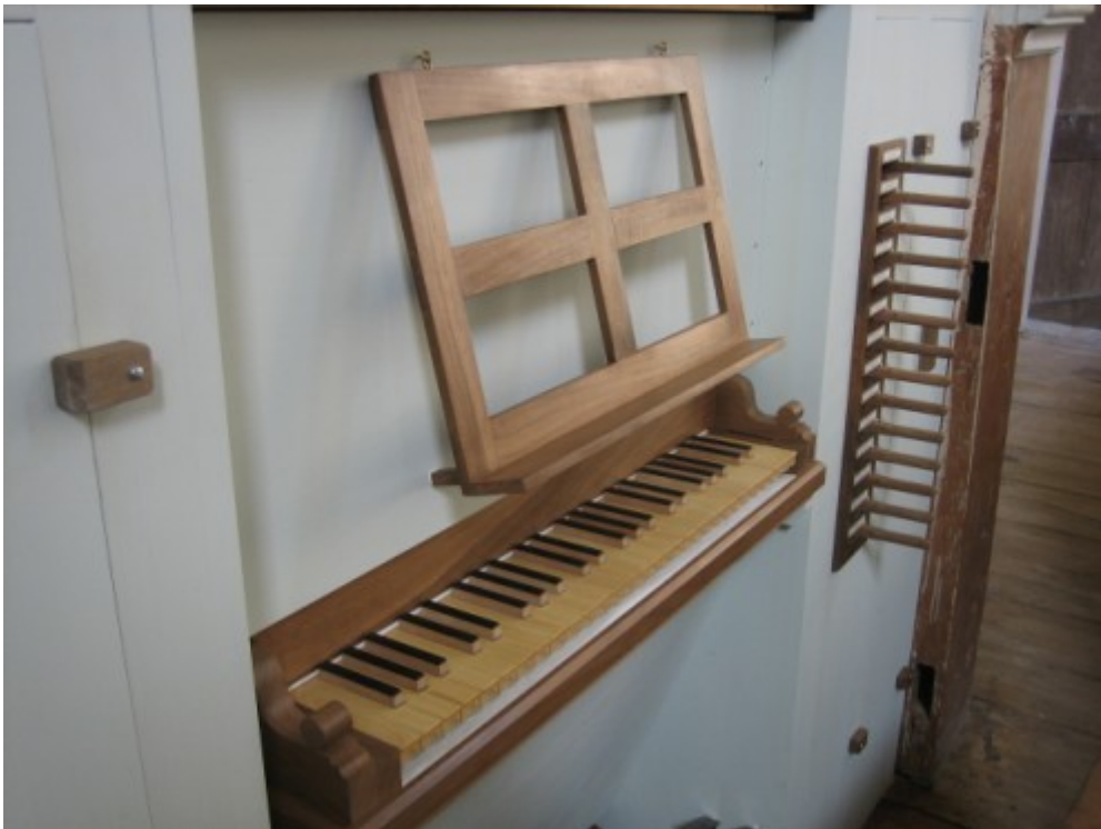
02 La tastiera con il leggio e i comandi dei registri