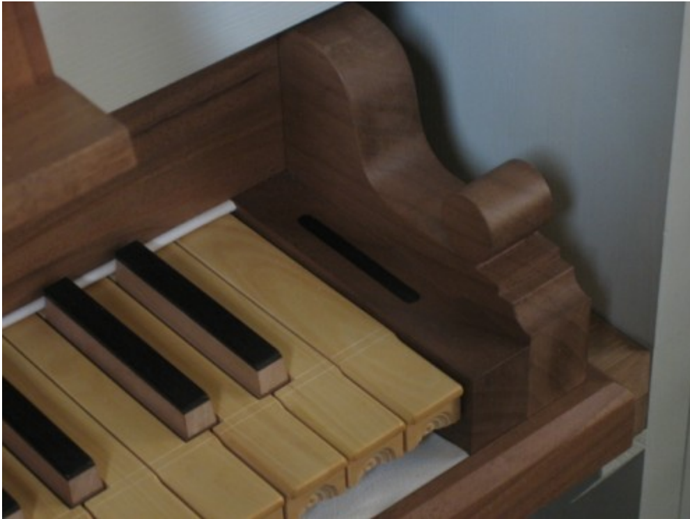
03 Incorniciatura in noce della tastiera: particolare del modiglioni di destra con il capotasto intarsiato con filetto in ebano