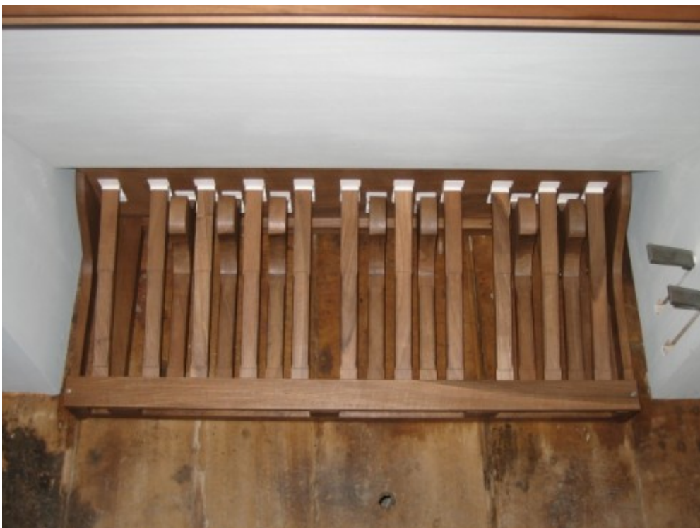
04 La pedaliera a leggio in noce