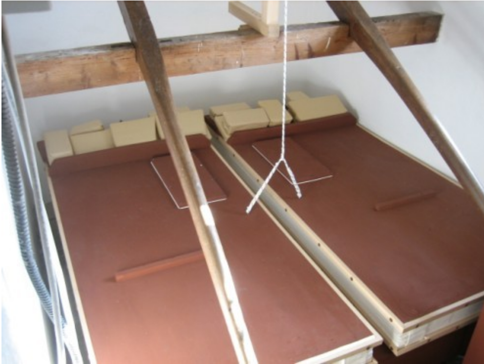
05 I mantici con le stanghe per il caricamento manuale