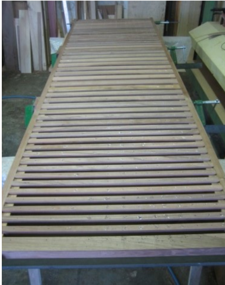
09 Costruzione del somiere maestro in laboratorio