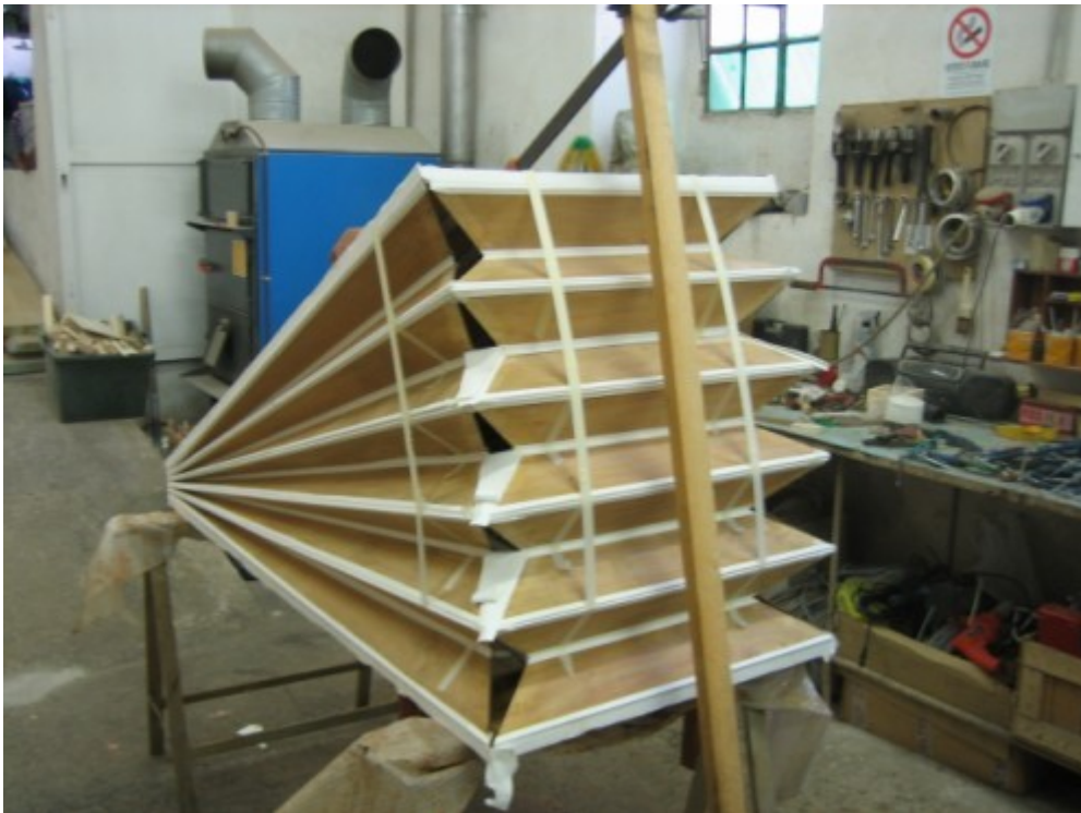
14 Impellatura dei mantici in laboratorio