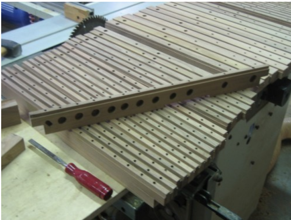
10 Separatori del somiere maestro