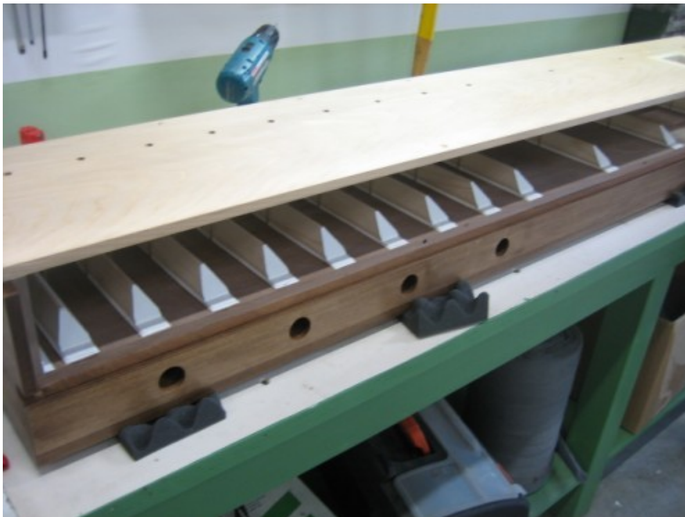
12 Somiere del contrabasso in laboratorio