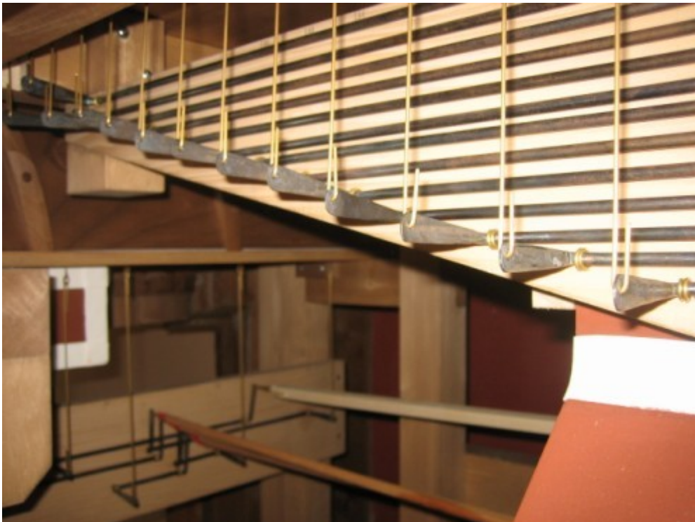
06 Catenacciatura del somiere Maestro