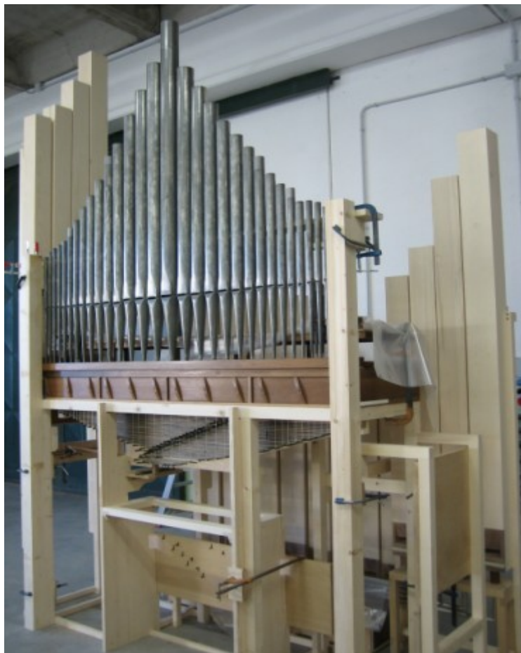
16 Montaggio dell'organo in laboratorio