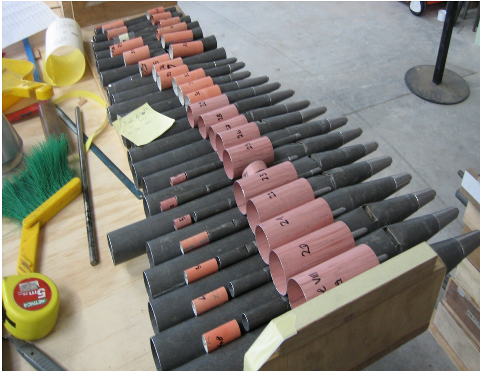
15 Preparazione degli anelli per le prolungher dei corpi delle canne