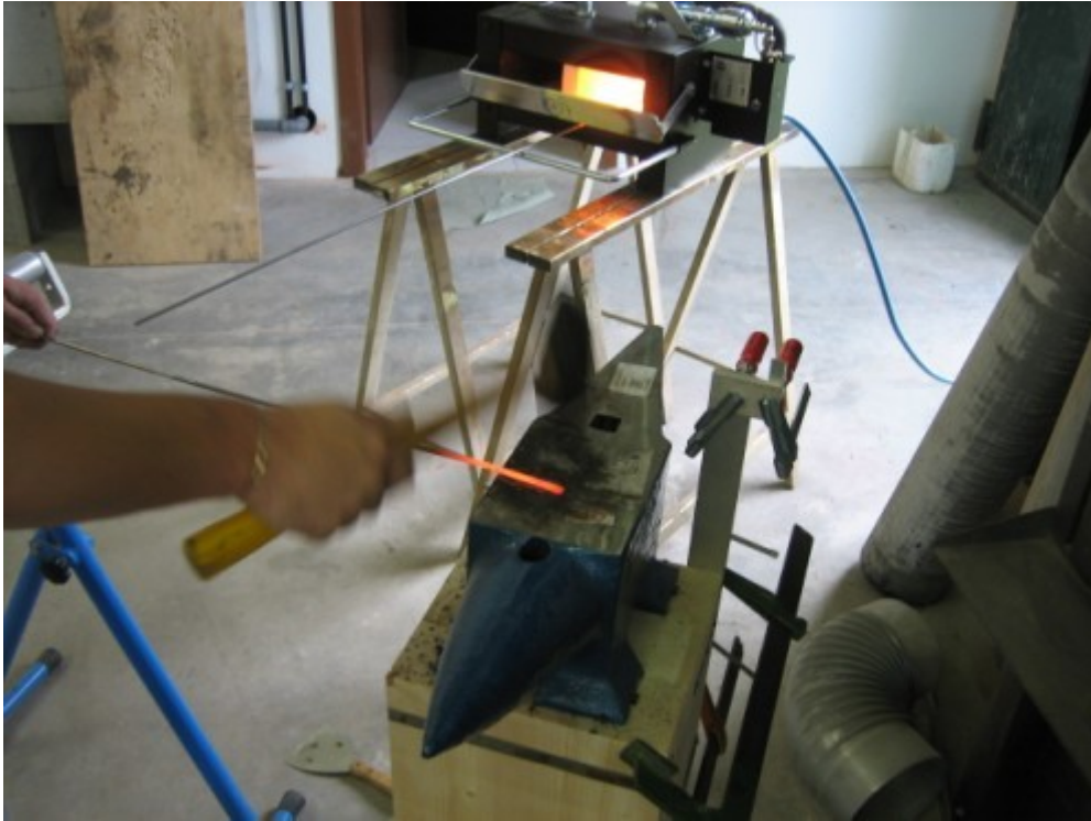
13 Costruzione delle catenacciature a ferro battuto