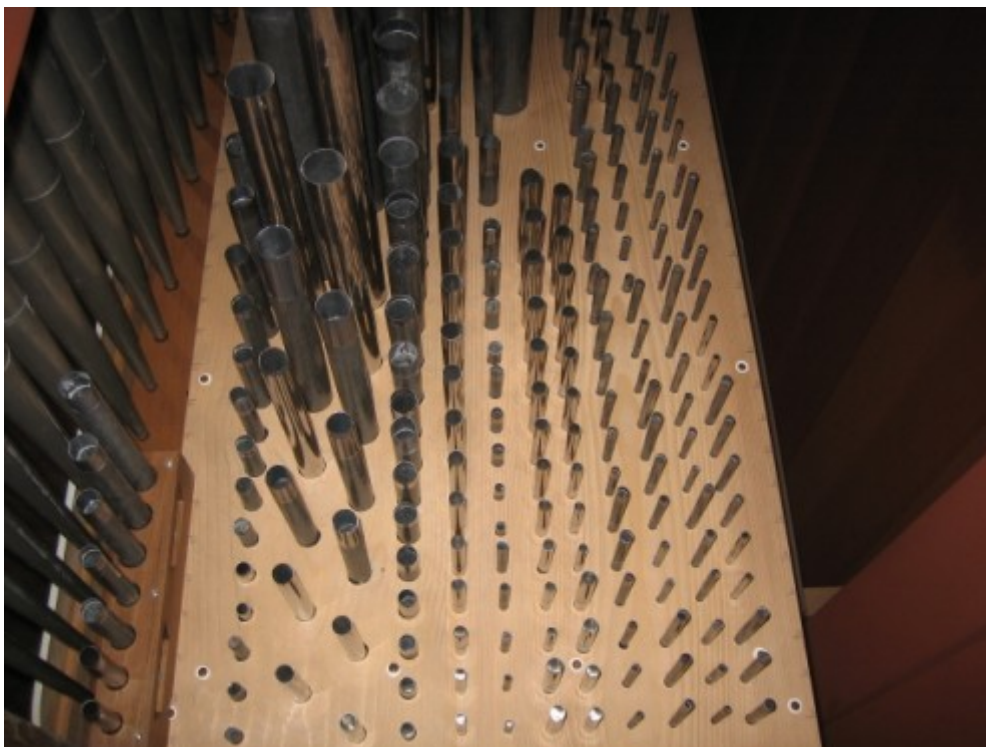
07 Canne interne sul somiere maestro