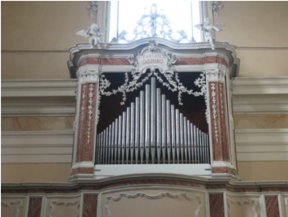
01 L'organo al termine dei lavori